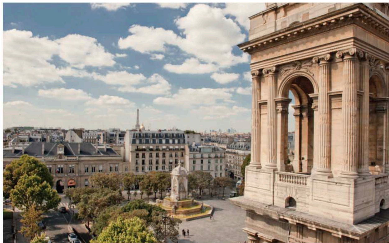
Appartement avec vue sur la place Saint-Sulpice

L' agence Varenne, implantée au cœur de la rive gauche depuis plus de 30 ans, est surtout connue et reconnue pour sa dimension humaine. L'équipe Varenne a conscience qu'un projet immobilier n'est pas une simple acquisition, c'est aussi une émotion. Les consultants Varenne sont avant toute chose des facilitateurs, les chefs d'orchestre d'une rencontre entre un client et un lieu. Les clients connaisseurs de la Rive Gauche comprennent ce sens de l'émotion, surtout quand ils recherchent une vue imprenable sur les Paulownias remarquables de la Place de Fürstemberg, une hauteur sous plafond digne des palais hongrois ou une terrasse ensoleillée de plain-pied. Tout projet immobilier s'accommode d'un rêve, ce rêve de posséder un morceau de l'histoire de Paris.