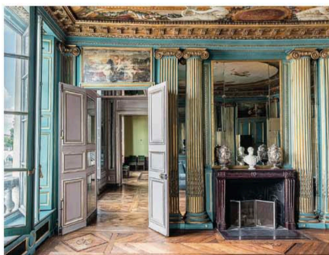
Quai de Seine, 240 m 2 , éléments d'origine conservés, Carré des Antiquaires

Bien que la presse évoque des difficultés notables sur le marché immobilier parisien, l'expression de « marché à double vitesse » prend